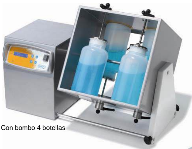
Con bombo 4 botellas

Agitador rotatorio digital, controlado por microprocesador.