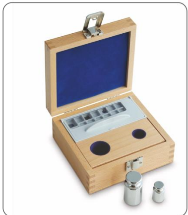
Holz-Etui für Gewichtssätze der Klasse E1 – F1