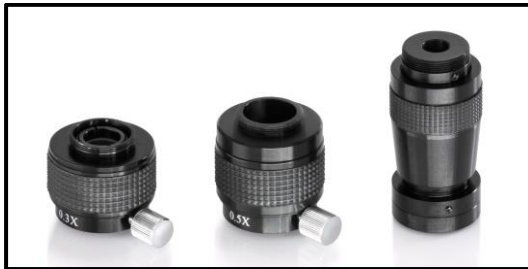
Adaptador de montaje C

La cámara y el adaptador se unen a través de la rosca de la montura C.