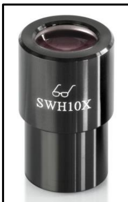
Ocular de punto de vista alto (reconocible por el símbolo de las gafas)