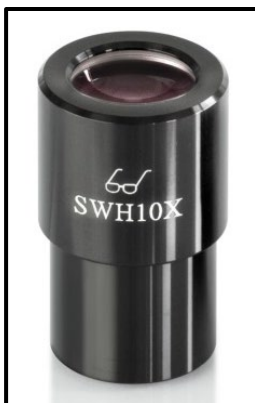
Ocular de punto de vista alto (reconocible por el símbolo de las gafas)