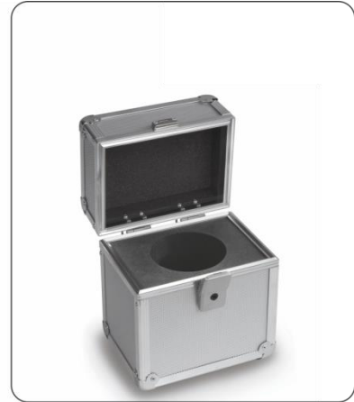
Aluminium-Etui für Einzelgewichte der Klasse E1, E2, F1 und F2