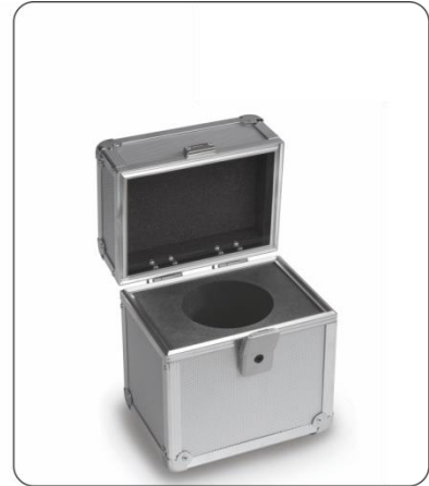
Aluminium-Etui für Einzelgewichte der Klasse E1, E2, F1 und F2