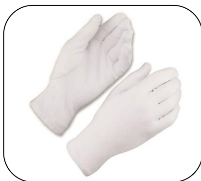
Baumwolle (KERN 317-280)