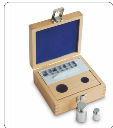
Holz-Etui für Gewichtssätze der Klasse E1 – F1