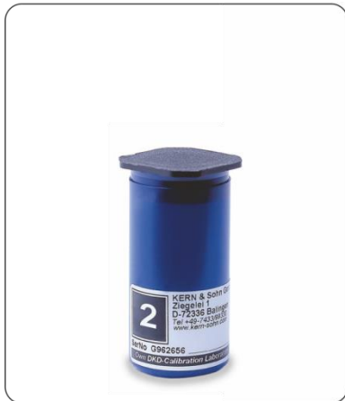
Kunststoff-Dose gepolstert für Einzelgewichte \leq 50 g alle Klassen