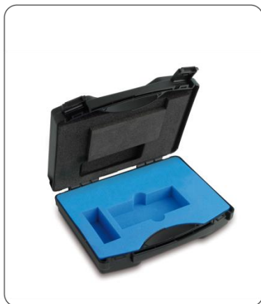
Kunststoff-Koffer für Gewichtssätze der Klasse E2 – M3