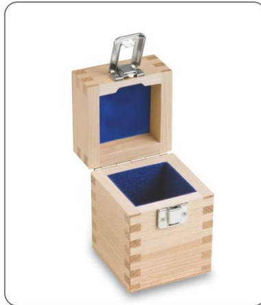
Holz-Etui gepolstert für Einzelgewichte der Klasse E1 – F1