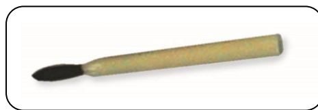
Staubpinsel KERN 318-270