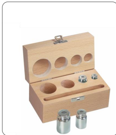
Holz-Etui für Gewichtssätze der Klasse F2 – M3