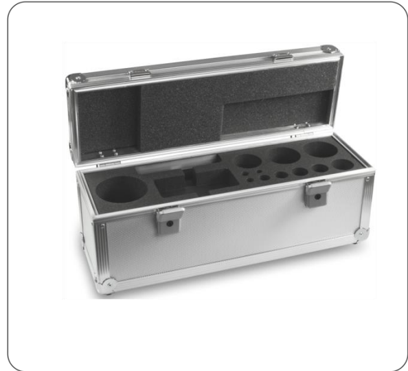
Aluminium-Koffer für Gewichtssätze der Klasse E1 – M2