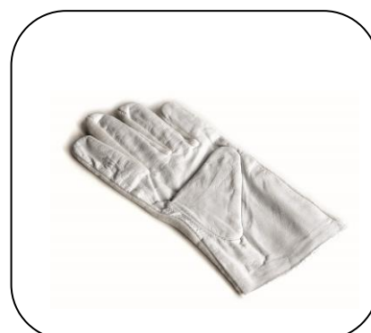
Leder / Baumwolle (KERN 317-290)

i Bei Prüfgewichten der Klasse M2 / M3 \geq 500 g, sowie lackierten Gussgewichten sind keine Hilfsmittel erforderlich. Sie dürfen mit trockenen und sauberen Händen gehandhabt werden.