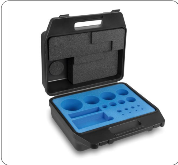
Kunststoff-Koffer für Gewichtssätze der Klasse E2 – M3