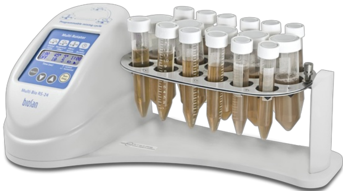
Multi Bio RS-24 Including PRS-26 platform Agitador rotatorio programable