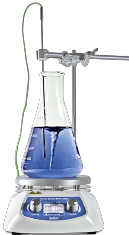
Intelli-Stirrer MSH-300i BS-010309-AAA Agitador magnético con placa caliente