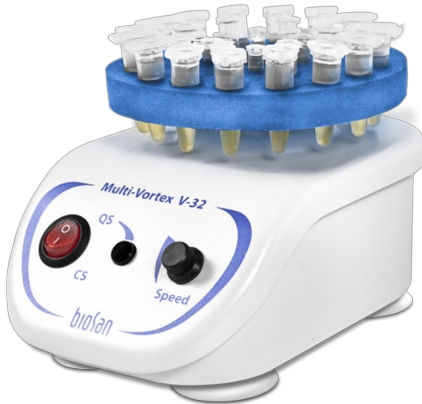
V-32 Including two platforms PV-32, PL-1 Agitador vórtex múltiple para tubos