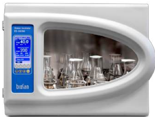
ES-20/80 Software included, without platform Agitador-incubador orbital