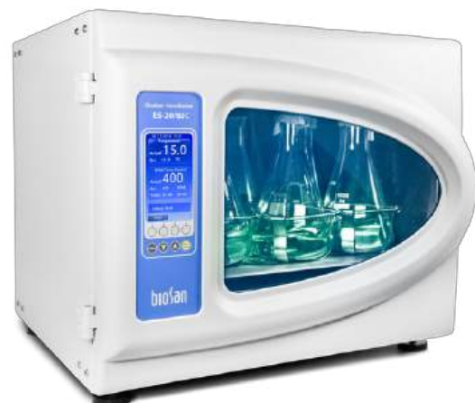
ES-20/80C Software included, without platform Agitador-incubador orbital con refrigeración