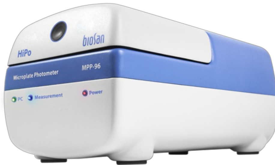
HiPo MPP-96 BS-050108-A02 fotómetro de microplacas