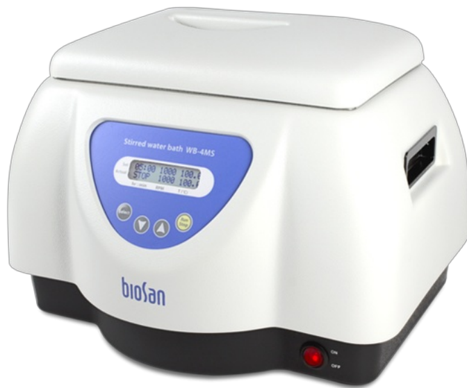
WB-4MS With base BP-1 and lid Baño termostático con agitación

El baño termostático con agitación, WB-4MS , está diseñado para la investigación en laboratorios químicos, farmacéuticos, médicos y biológicos.