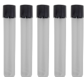
Tubos de muestra 16mm BS-050102-MK

Tubos de muestra de vidrio 16x100mm, alto contenido de borosilicato, tapa de PP con almohadilla de silicona. Embalaje - 100 piezas/caja