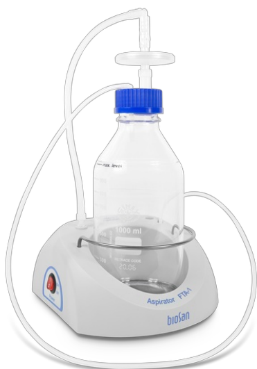
FTA-1 BS-040108-AAG Aspirador con soporte para frascos