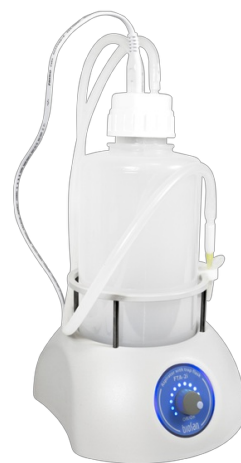
FTA-2i BS-040120-A02 Aspirador con soporte para frascos