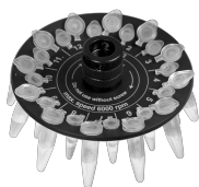
R-05/0.2 BS-010205-BK rotor

Rotor para 12 tubos de microanálisis de 0,5 ml y 12 tubos de microanálisis de 0,2 ml