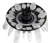
R-2/0.5/0.2 BS-010205-DK rotor

Rotor para 8 tubos de microanálisis de 2/1,5 ml y 8 tubos de microanálisis de 0,5 ml