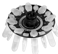
R-2/0.5 BS-010205-CK rotor

Rotor para 12 tubos de microanálisis de 1,5/2 ml