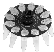
R-15 BS-010205-AK rotor

Rotor para 12 tubos de microanálisis de 0,5 ml y 12 tubos de microanálisis de 0,2 ml