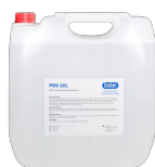
Solución de descontaminación de ADN/ARN PDS-250 BS-040107-FK 10l

Solución de descontaminación de ADN/ARN.