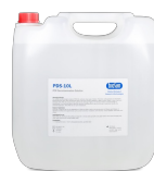
Solución de descontaminación de ADN/ARN PDS-250 BS-040107-FK 10l

Solución de descontaminación de ADN/ARN.