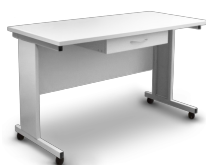
T-4L BS-040107-BK Mesa

El nuevo diseño modular de los muebles de laboratorio proporciona flexibilidad y facilidad de uso.