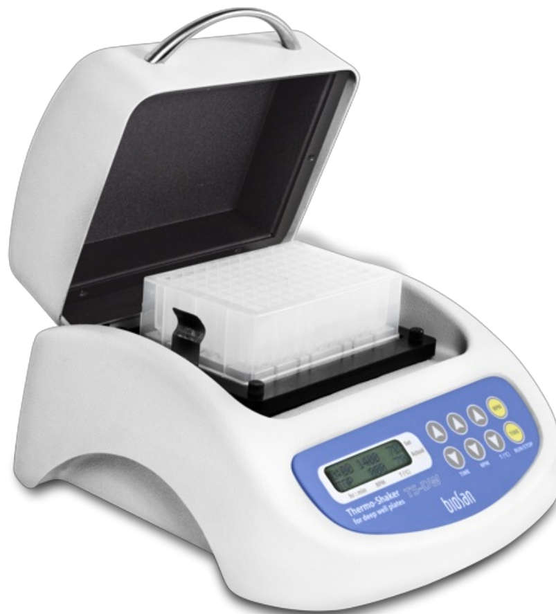
TS-DW Without thermoblock Agitador térmico para placas de pocillo profundo