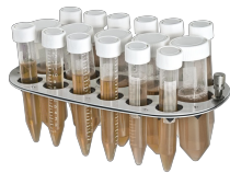
PRS-5/12 BS-010117-HK plataforma

Tiene capacidad para 26 tubos de 10-16 mm de diámetro (1.5-15 ml)