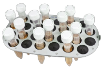
PRS-26 BS-010117-GK plataforma

Tiene capacidad para 26 tubos de 10-16 mm de diámetro (1.5-15 ml)