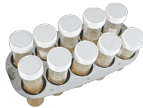
PRS-10 BS-010117-IK plataforma

5 tubos de 20-30 mm de diámetro (tubos de 50 ml) y 12 tubos de 10-16 mm de diámetro (tubos de 1,5 ml - 15 ml)