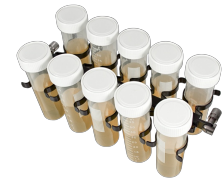
PRSC-10 BS-010117-JK plataforma

Tiene capacidad para 22 tubos de hasta 16 mm de diámetro (hasta 15 ml)