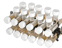
PRSC-22 BS-010117-LK plataforma

10 tubos de 20-30 mm de diámetro (tubos de 50 ml)