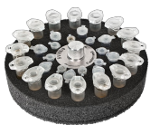
SV-16/8 BS-010210-CK plataforma

16/8/8 tomas para tubos de microanálisis de 1,5/0,5/0,2 ml (Ø 11/8/6 mm)