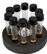
SV-10/10 BS-010210-BK plataforma

16/8/8 tomas para tubos de microanálisis de 1,5/0,5/0,2 ml (Ø 11/8/6 mm)