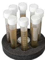
SV-8/15 BS-010210-DK plataforma