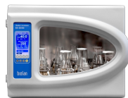
ES-20/80 Software included, without platform Agitador-incubador orbital