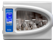
ES-20/80 Software included, without platform Agitador-incubador orbital