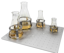
UP-168 BS-010135-JK plataforma