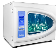
ES-20/80C Software included, without platform Agitador-incubador orbital con refrigeración